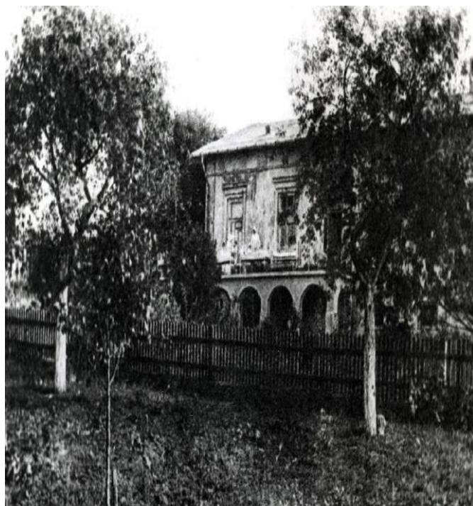
Posiadłość Nowy Łan w 1920 roku

Szpital przystosowany z zakupionego budynku mieszkalnego był niewystarczający, na Posiedzeniu Towarzystwa Przyjaciół Szpitala Dziecięcego 21.VI.1924 r. podjęto decyzję o budowie nowego budynku zakaźnego.